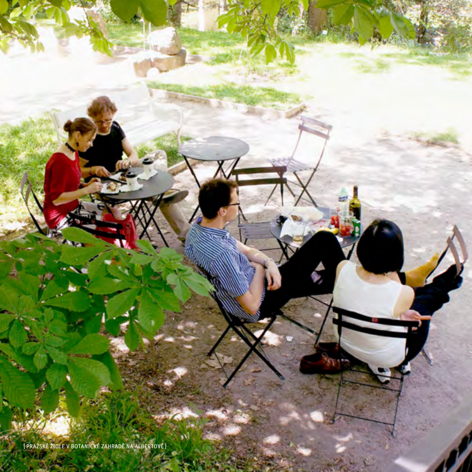
[PRAŽSKÉ ŽIDLE V BOTANICKÉ ZAHRADĚ NA ALBERTOVĚ]