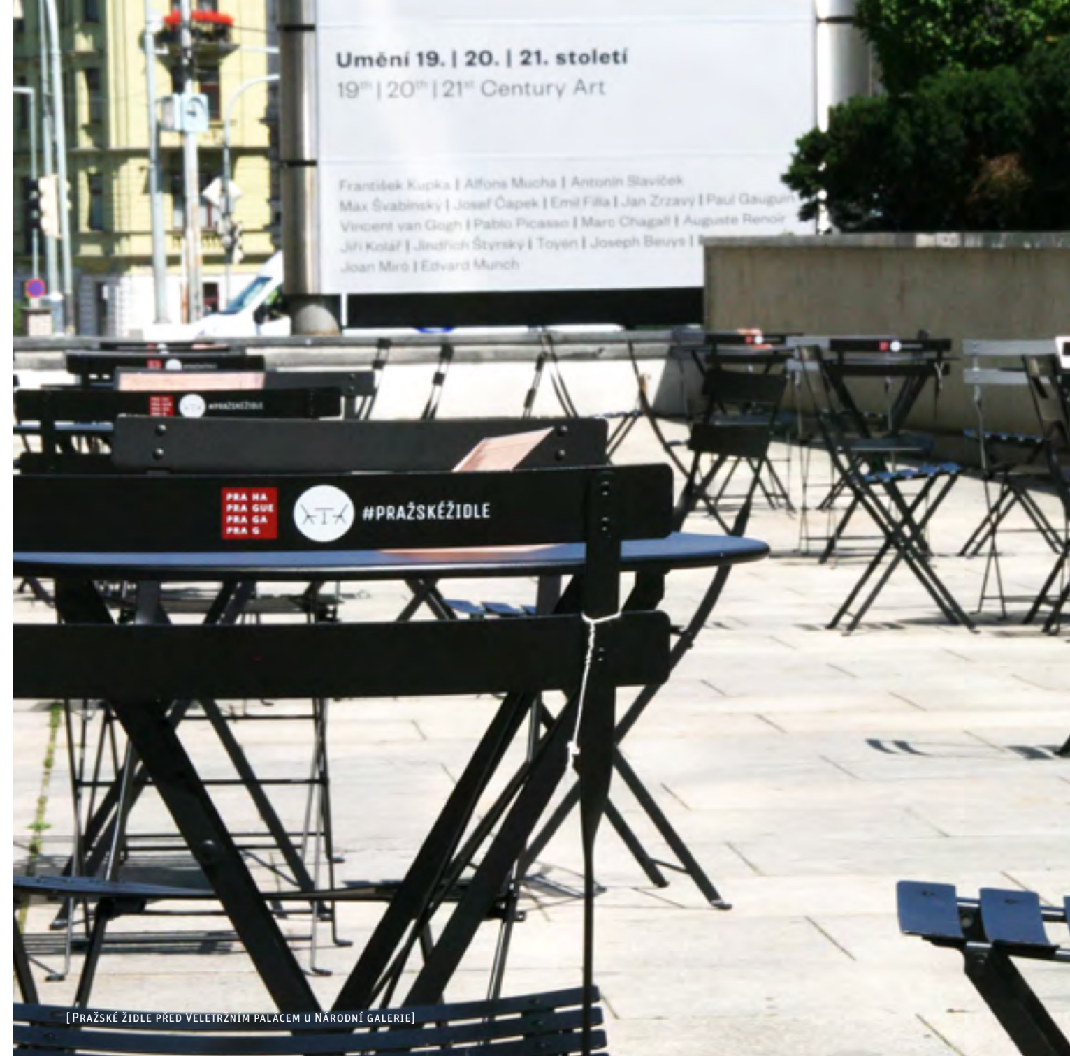
[ PRAŽSKÉ ŽIDLE PŘED VELETRŽNÍM PALÁCEM U NÁRODNÍ GALERIE ]

[ OBÁLKA → Pražské židle a stolky na nám. Václava Havla, 2017 ]